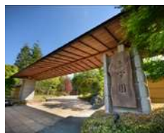
茶寮宗園 (P7 参照)