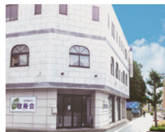
社会福祉法人 敬寿会 (P7 参照)