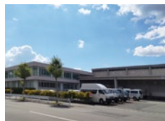
オビサン株式会社 (P7 参照)